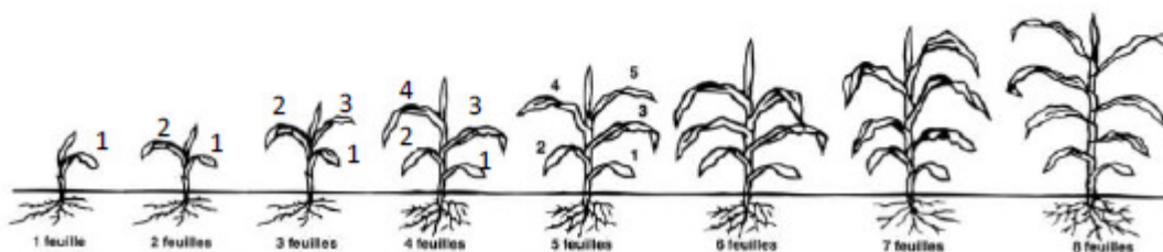
FIGURE 9-1. Stades de croissance foliaire du maïs (méthode de la feuille recourbée).

Une difficulté dans le décompte des feuilles vient aussi de l'incertitude quant à la feuille à considérer comme la première feuille. Dans la présente publication, la première feuille est la feuille du bas du plant. Cette première feuille est plus petite que les autres et sa pointe est arrondie. À mesure que la plante grandit, les premières feuilles finissent par mourir et tomber. Ainsi, un plant de 10 feuilles peut être incorrectement identifié comme un plant de 7 feuilles parce que 3 de ses feuilles sont tombées ou flétries, sans qu'il y paraisse à première vue. Il faut donc se montrer vigilant.